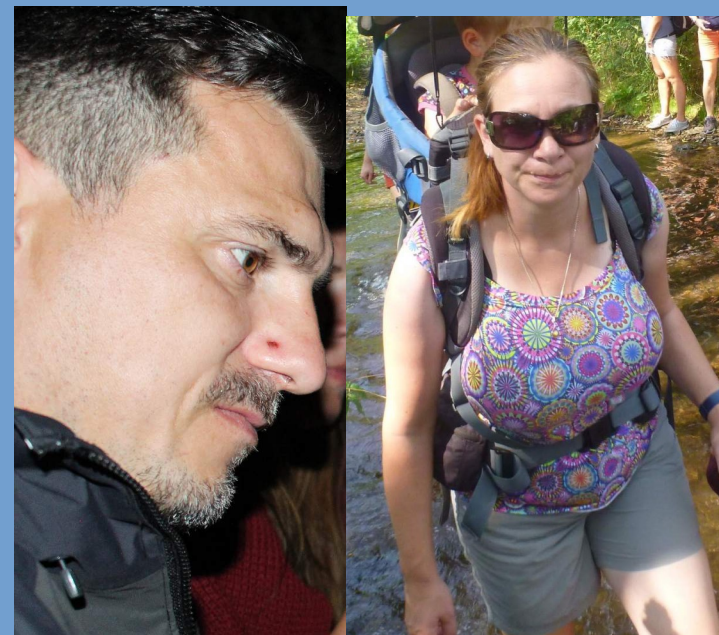
MICHELÍN + PYŽLA